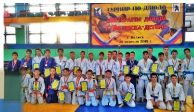
Дзюдо (возраст – с 7 лет) – Зал дзюдо (ул. Ленина, 61 б)