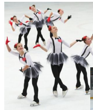
Фигурное катание на коньках (возраст – с 6 лет) – ледовый комплекс «Ариада»