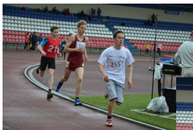
Легкая атлетика (возраст – с 8 лет) – ул. Либкнехта, 128 (учебное здание школы-интерната)