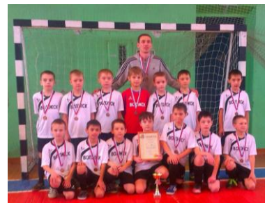
Футбол (возраст – с 7 лет) – Волжский городской стадион, спортивный зал (ул. Грибоедова, 2а)