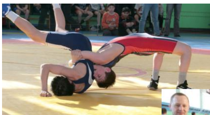
Греко-римская борьба (возраст – с 7 лет) – МОУ СШ № 2 МОУ СШ № 6