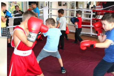
Бокс (возраст – с 8 лет) – ул. Либкнехта, 128 (учебное здание школы-интерната)