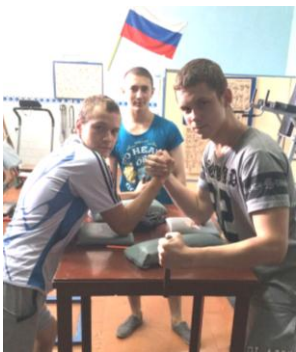
Армспорт (возраст – с 14 лет) – профтехучилище № 15